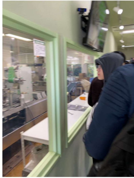
田丸屋でわさび工場を見学