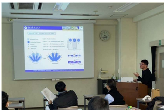
台湾の学生の発表

静岡大学および台湾科技大学の学生が英語で研究発表および質疑応答を行いました。夜は、島村・藤井研の学生全員と台湾の方々とで晚餐会をしました。