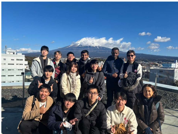
富士山世界遺産センター

午前中は富士山世界遺産センター、富士山本宮浅間大社に行き、富士山の歴史や文化を学びました。午後は三保の松原に行った後、わさび漬の田丸屋に行き、わさび工場を見学しました。