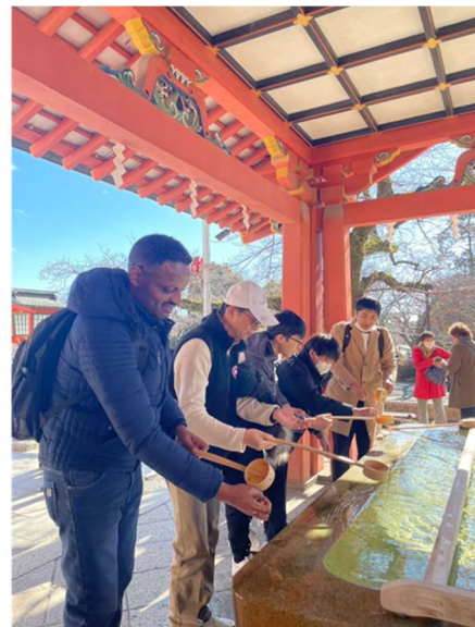
浅間大社で手水を体験