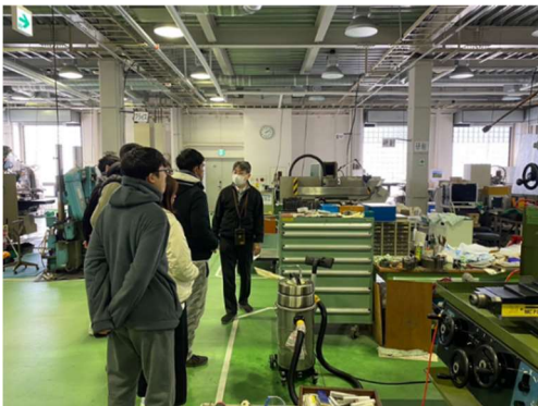
工作センター見学