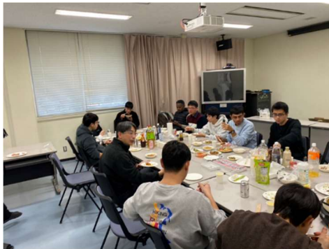
フェアウェルパーティー

お昼ごろに買い出しに行き、各国の料理を作り、パーティーをしました。日本からはたこ焼きとお好み焼きをふるまいました。