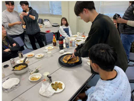
お好み焼きをふるまう