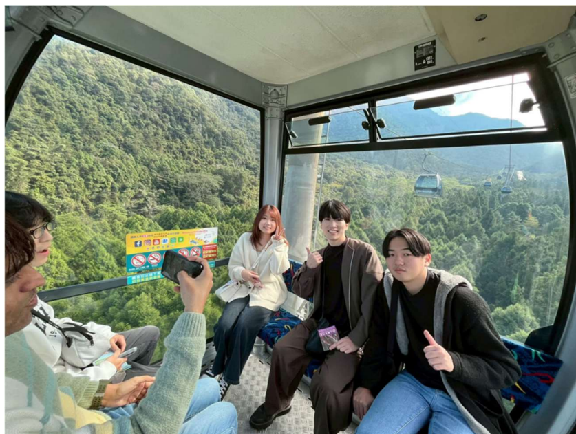
ロープウェイで移動