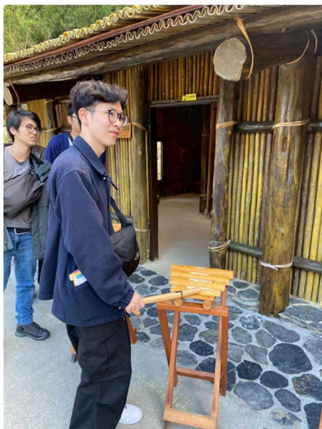
先住民族の楽器の体験

日月潭へ移動し、九族文化村で先住民族の歴史や文化を学習しました。民族で使用されていた楽器や弓矢の体験をしました。九族文化村周辺をロープウェイで移動し、日月潭の豊かな自然を堪能しました。