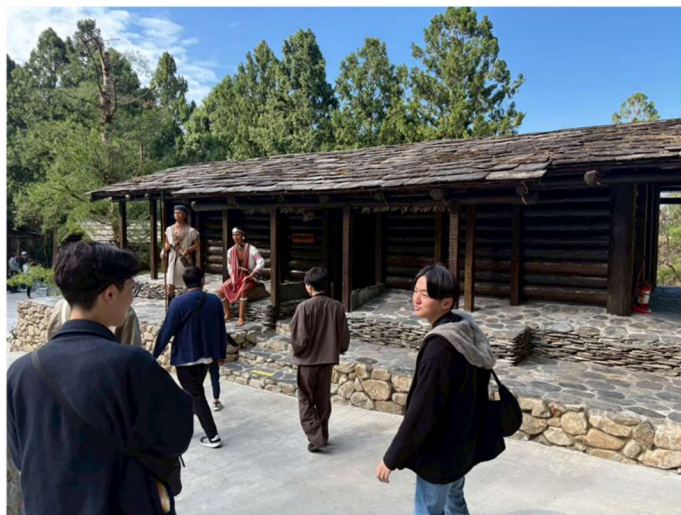
先住民族の民家の見学