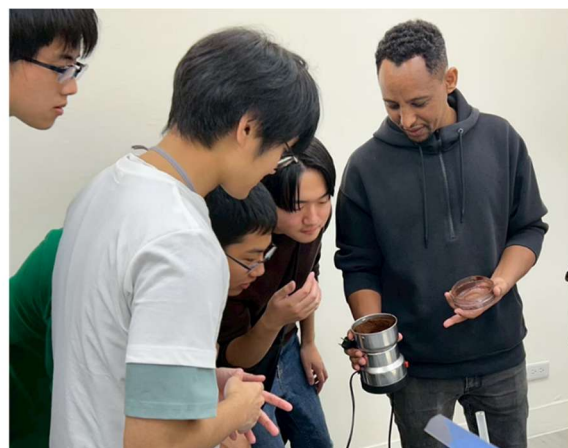
コーヒーをふるまっていたく