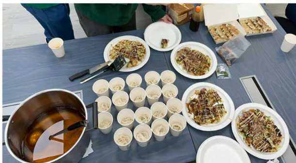
お好み焼き・うどんをふるまう