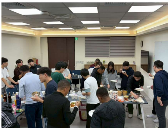
お別れパーティー

台湾の学生と留学生，日本の学生で各国の料理を調理し，交流パーティーをしました。日本からはお好み焼きとうどんを調理してふるまいました。