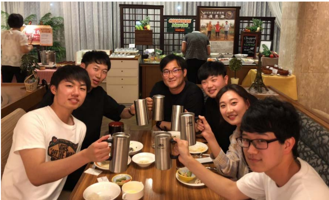
活発に交流する学生たち