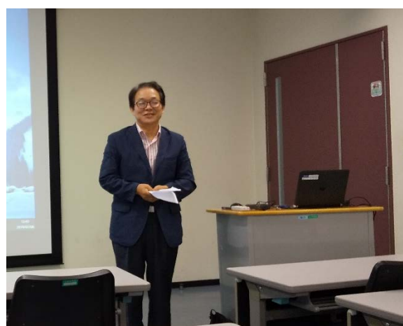
ソン先生の御挨拶