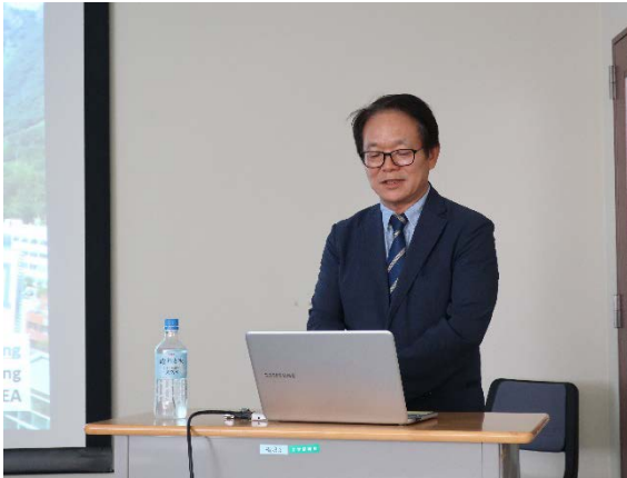
ソン先生の特別講演