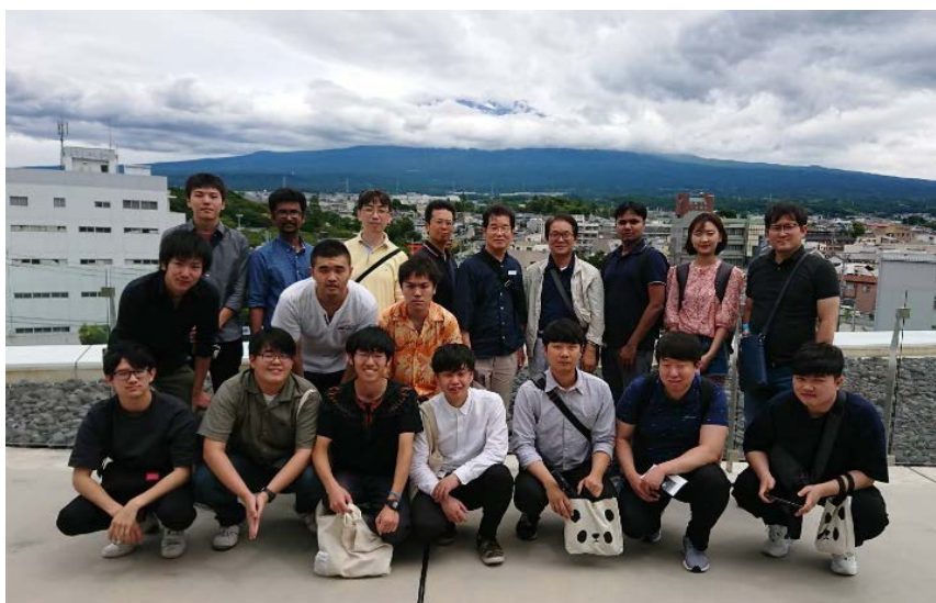
富士山世界遺産文化センターでの集合写真