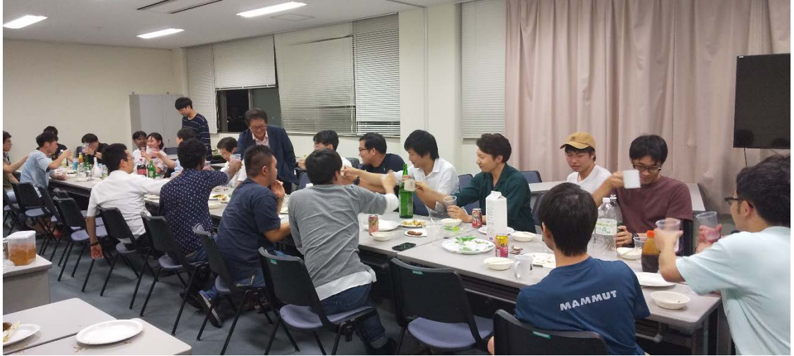
韓国のお酒で乾杯